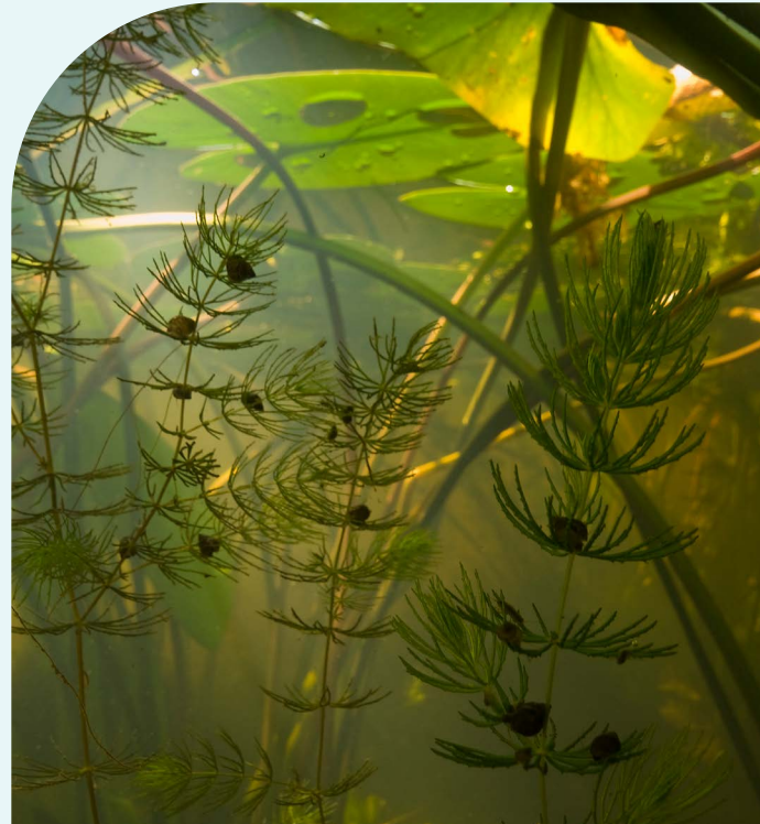
Onderwaternatuur met kranswieren

Een deel van de waterkeringen, (hoofd)watergangen en oevers waarvan het hoogheemraadschap beheerder is, wordt door particulieren, beheerorganisaties en